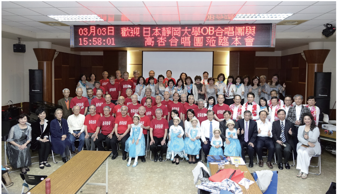
日本靜岡大學 OB 合唱團蒞臨本會與本會合唱團交流聯誼

襲，一舉消滅埃空軍，9AM 納瑟致電胡笙確認埃及獲勝，並表示已摧毀以空軍，猶豫不決的胡笙於是下令出兵，11:30AM 以摧毀約空軍，同時揮軍攻入耶路撒冷舊城，進佔西牆，隨軍拉比走到西牆，開始誦念禱文，士兵們祈禱、哭泣、拍手、跳舞，這是兩千多年來猶太人首次回到哭牆。胡笙(1935-99)喪失了大半領土及珍貴的耶路撒冷，懊惱不已。1994 還為圓頂清真寺的圓頂鍍上 80 公斤純金支付費用，因為他仍認為自己是清真寺的守護者。