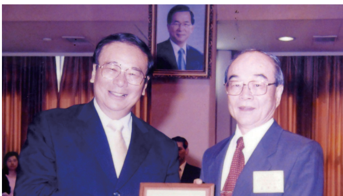
江英隆獲當時擔任行政院長的張俊雄，頒獎肯定。