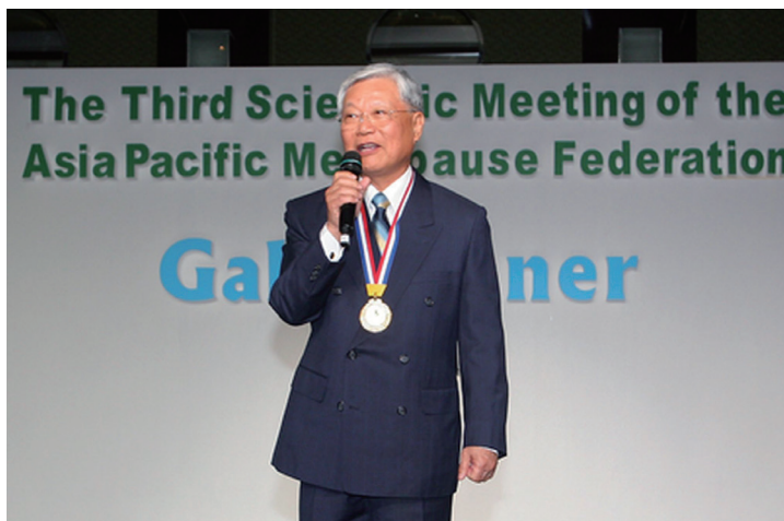
黃國恩醫師在醫界寫下多項第一紀錄，享譽國際。