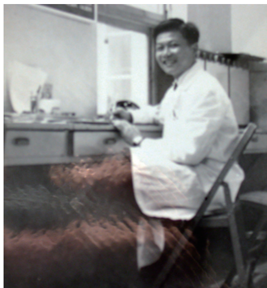
畢業後在台大醫院婦產科服務。