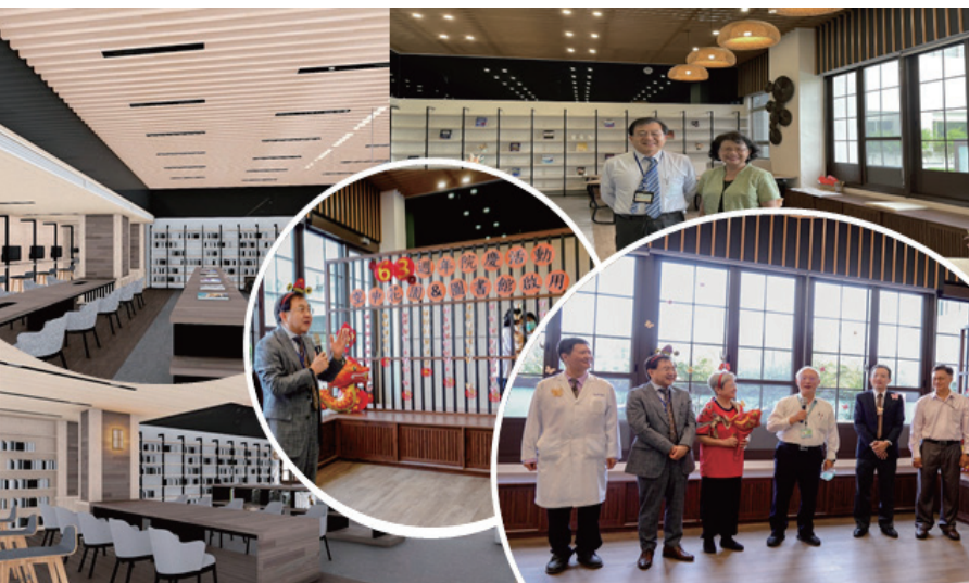
圖書室 空中療癒花園 Library & Sky Healing Garden