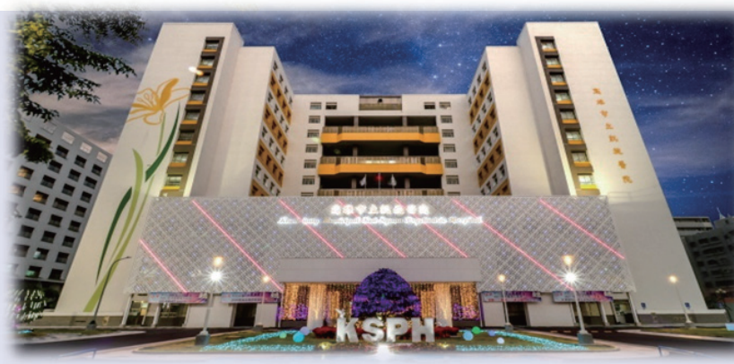
圖一：打造台灣精神醫療新樂園、建構智慧藝文花園心醫院

以『滾動的石頭不生苔』之哲學，鼓勵同仁多參與各項競賽，藉由改善各項醫療服務品質，進而提昇同仁的專業知能與自信心。另外，參加及舉辦各項國際會議、申請各項研究與補助計畫，並且鼓勵同仁進修與取得教職，讓專業人員的專業素質明顯提升，迄今已經有二百多位碩博士與三十多位同仁取得教職。為進一步提升本院的量能，進而將『打造台灣精神醫療的新樂園』變成『打造台灣精神醫療的新樂園，建構智慧藝文花園心醫院，讓凱旋成為身心復能的精神醫療機構』。近三年（民國110-112）來，凱旋醫院獲得許多榮耀與肯定，其中重要的得獎獎項如圖二-四。