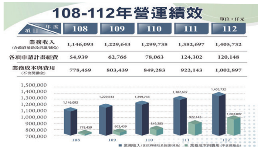
表一：民國108-112年度營運績效

大流行，對於醫院的治理與營運更是一大考驗，一方面，必須配合政府政策做好防疫措施，另一方面，又必須兼顧醫院績效，實在是考驗管理者的智慧，幸而在全體同仁全力配合下，我們危機處理得當，順利度過危機，不僅沒有營運下降，反而進一步提升，然而在面對危機的過程中，也凝聚了同仁的團結合作共識。因此，近四年的業績如表一。